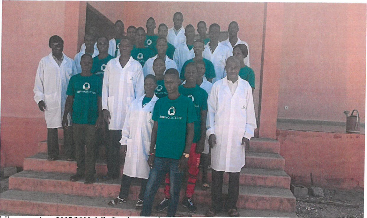
Photo della promozione 2017/2018 della Scuola Agricola Togo costruita da AVP e Partner

Associazione Villaggio Planetario Aderente AUSER